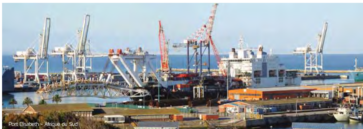
Port Elisabeth - Afrique du Sud

Afrique du Sud - Algérie - Angola - Bénin - Burkina-Faso - Cameroun - Congo Brazaville - Côte d'Ivoire - Egypte - Ethiopie - Gabon - Ghana - Guinée Conakry - Ile Maurice - Libye - Kenya - Mali - Madagascar - Maroc - Mauritanie - Mozambique - Namibie - Niger - Nigéria - République centrafricaine - République Démocratique du Congo - Rwanda - Sénégal - Soudan - Tanzanie - Tchad - Togo - Tunisie - Zambie ... liste non exhaustive