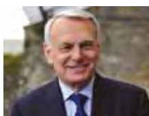
Jean-Marc AYRAULT (*) Ministre des Affaires Etrangères et du Développement International

Destinée à illustrer les nouvelles dynamiques entrepreneuriales françaises et africaines, cette séance inaugurale donnera la parole à des personnalités qui impulsent ou incarnent une dynamique de croissance partagée entre la France et le continent africain. Avec la participation de