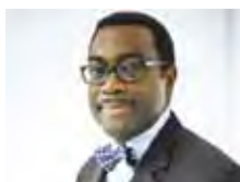
Akinwumi ADESINA (*) Président, Banque africaine de développement