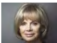
Elisabeth GUIGOU (*) Présidente de la commission des Affaires Etrangères de l'Assemblée nationale