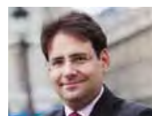
Matthias FEKL (*) Secrétaire d'Etat en charge du Commerce Extérieur