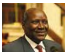
Daniel Kablan DUNCAN (*) Premier ministre de Côte d'Ivoire