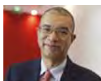
Lionel ZINSOU Président d'AfricaFrance