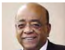
Mo IBRAHIM (*) Chairman, Mo Ibrahim Fondation