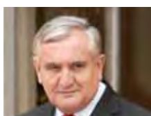
Jean-Pierre RAFFARIN Président de la commission des affaires étrangères, de la défense et des forces armées