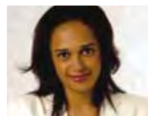
ISABEL DOS SANTOS (*) Femme d'affaires angolaise