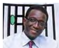
Amadou BA (*) Ministre sénégalais de l'Economie, des Finances et du Plan, en présidence du NEPAD