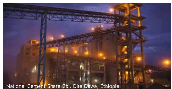
National Cement Share Co., Dire Dawa, Éthiopie

Les rencontres se dérouleront dans les espaces dédiés de la manifestation. Un moyen idéal et personnalisé de développer son activité en Afrique et avec l'Afrique !