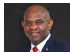
Tony ELUMELU (*) Président, Heirs Holdings